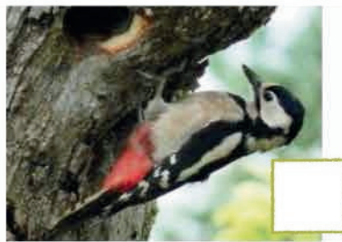
Pic épeiche (Maryvonne Goudinoux)