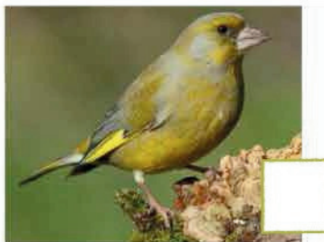
Verdier d'Europe (Thierry Veau)