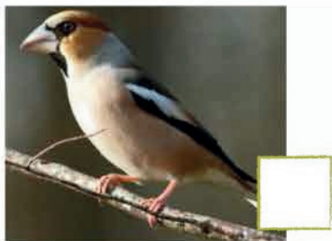
Grosbec casse-noyaux