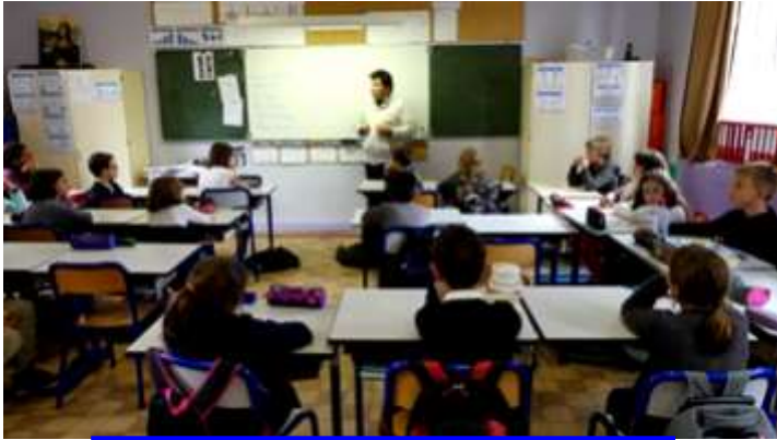
Dis, monsieur, comment on fait pour voter ?