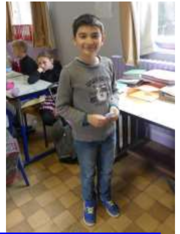
L'isoloir est occupé, les électeurs attendent leur tour !