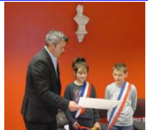
A peine élus, ils ont commencé à étudier leurs premiers dossiers ! Le plan de la nouvelle école leur est présenté par M. le maire !