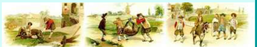
Un meunier et son fils Allaient vendre leur âne un certain jour de foire. On lui fit les pieds Le premier qui les vit de rire s'éclata Il fit monter son fils C'était à vous de suivre, au vieillard de monter.

Pour détendre l'atmosphère, voici une petite devinette : Quel est le seul produit au monde qui est livré directement à votre domicile, qui est disponible en permanence ou presque, et qui coûte moins de 3 euros la tonne, TTC et frais de livraison compris ? Réponse page 14