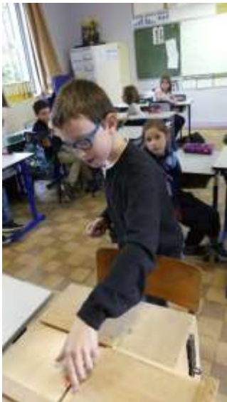
A voté !