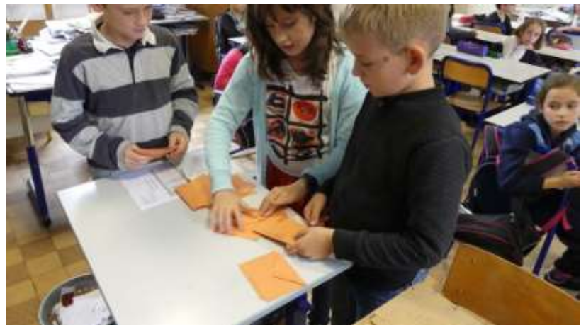
C'est déjà l'heure du dépouillement, après avoir bien contrôlé que le nombre d'enveloppes dans l'urne correspond au nombre de signatures. Les six candidats ont participé au dépouillement.