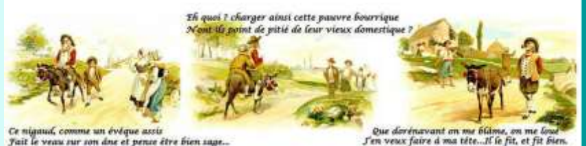
Et quoi ? charger ainsi cette pauvre bourrique N'ont-ils point de pitié de leur vieux domestique ? Ce nigaud, comme un évêque accis Fait le veau sur son âne et pense être bien sage... Que dorénavant en me blâme, on me loue J'en veux faire à ma tête...Il le fit, et fit bien.