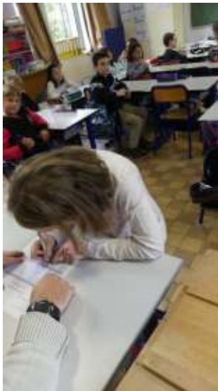
Et la petite signature !