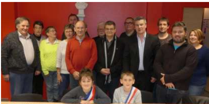
« Lorsque l'enfant parait, le cercle de famille applaudit à grands cris... » ! - Victor HUGO -