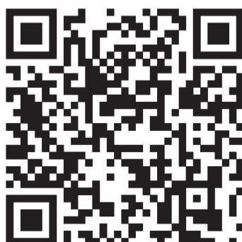
Programme et réservation