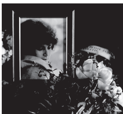
(Château de Villequiers)